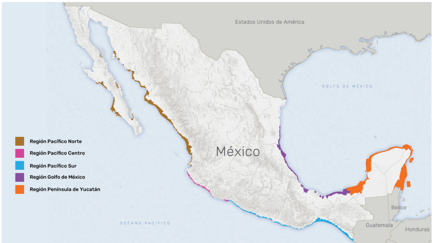
Figura 2. Superficie ocupada por manglares en México.

Estos ecosistemas costeros secuestran el carbono presente en la atmósfera. Sin embargo, si los ecosistemas costeros están degradados o dañados , la capacidad de almacenamiento de carbono será seriamente afectada o nula; además de que el carbono secuestrado será liberado a la atmósfera .